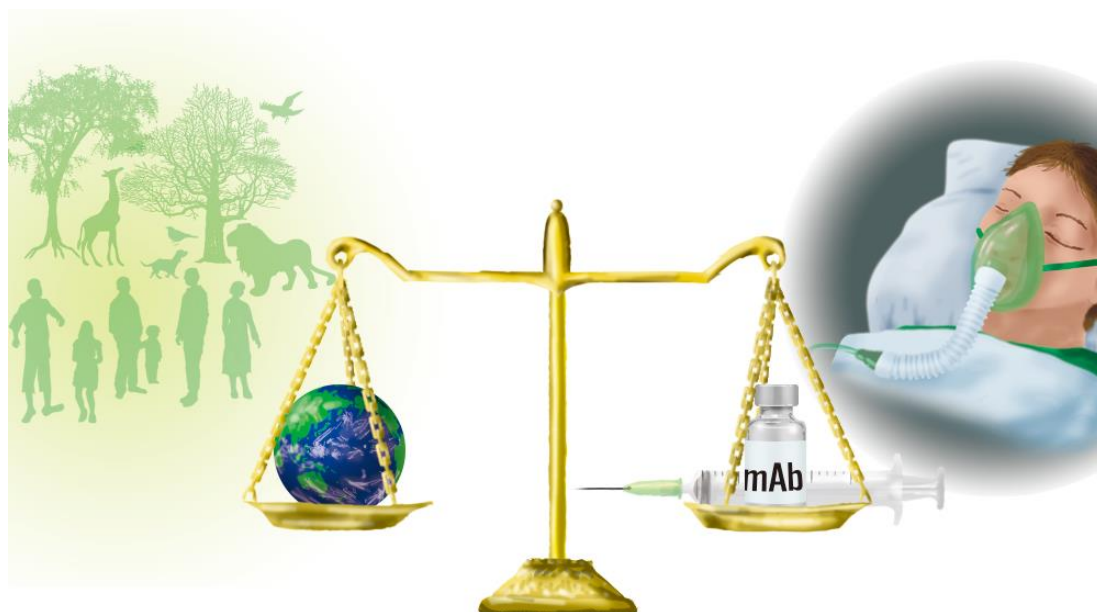
図1 本研究で提案した、モノクローナル抗体の環境影響と健康効果の比較評価に関する新概念 (発表論文から抜粋)